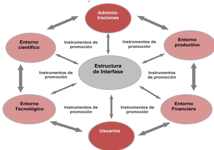
Gráfico 1. Los entornos y desarrollo de interrelaciones de un SNI